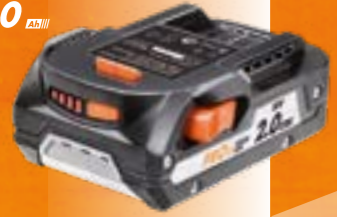
Batterie 18V 2,0 Ah L1820R/4932430169 92 68 CHT* | 111 22 CTTC*

BATTERIES 100% RÉTRO-COMPATIBLE POUR TOUS VOS OUTILS DEPUIS 10 ANS