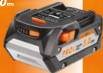
Batterie 18V 5,0 Ah L1850R/4932451630 118 70 CHT* | 142 44 CTTC*