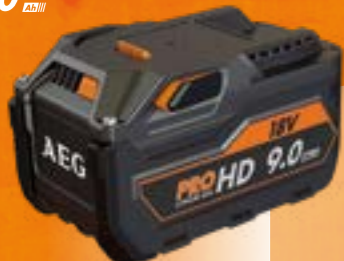
Batterie 18V 9,0 Ah L1890R-HD/4932464231 166 10 CHT* | 199 32 CTTC*