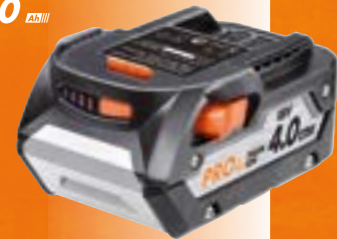
Batterie 18V 4,0 Ah L1840R/4932430170 102 66 CHT* | 123 19 CTTC*